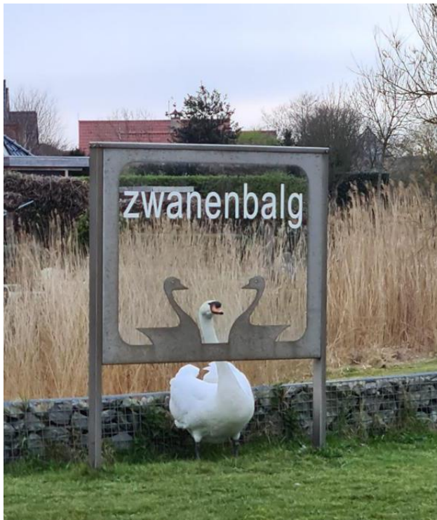
Foto van Irma uit de Zwanenbalg (bedankt voor deze ludieke foto).

In onze wijk is het al volop voorjaar met de kleurrijke bloembollen en bloeiende bomen. We worden verwend met een heerlijk zonnetje en ook het zwanennest bij de entree is al bezet en bewaakt door Pa-Zwaan.