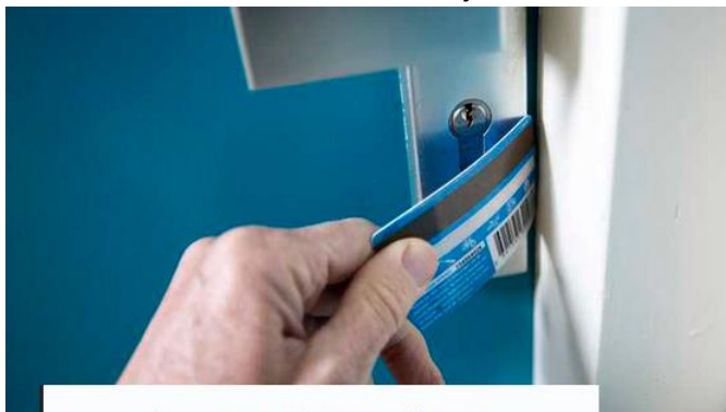
Als er wordt ingebroken met de flippermethode, zijn er geen braaksporen.

De deur op slot draaien is één ding, maar dan moet het wel een goed slot zijn. Schroefjes aan de buitenkant zijn bijvoorbeeld een slecht teken: je wil niet dat een dief met een schroevendraaier zo je huis binnenkomt. Met (professioneel)